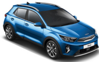
Bathysblau Met. (SPB)