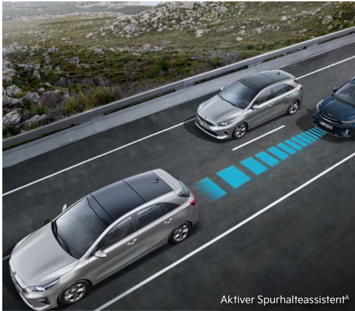
Aktiver Spurhalteassistent A

Im Kia Stonic kannst du dich rundum sicher fühlen: Moderne Assistenzsysteme A unterstützen dich dabei, in Gefahrensituationen schnell und angemessen zu reagieren.