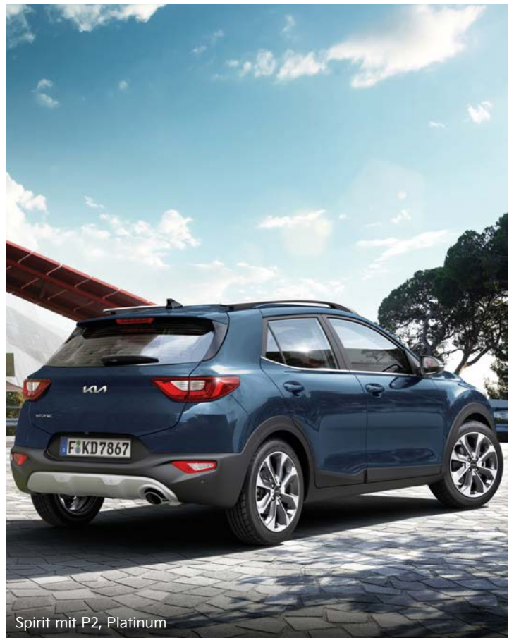
Spirit mit P2, Platinum