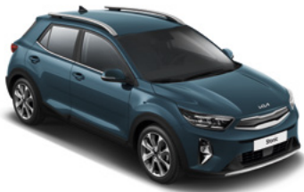
Denimblau Met. (EU3)