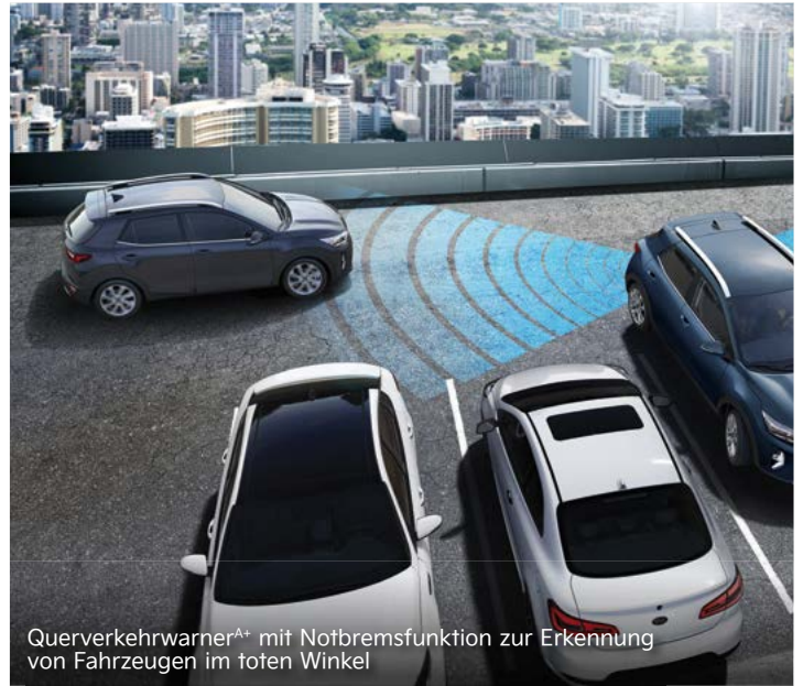
Querverkehrswarner A+ mit Notbremsfunktion zur Erkennung von Fahrzeugen im toten Winkel