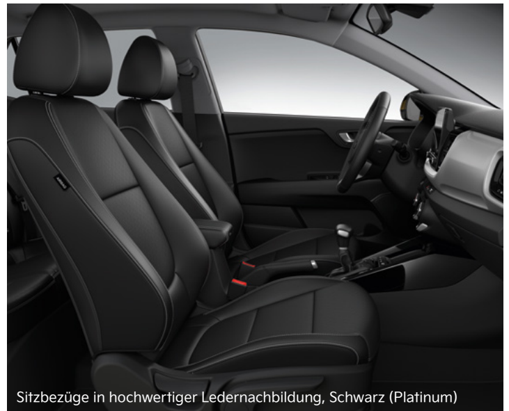
Sitzbezüge in hochwertiger Ledernachbildung, Schwarz (Platinum)