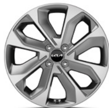
17-Zoll-Leichtmetallfelgen (Spirit und Platinum)