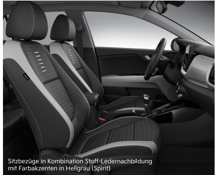
Sitzbezüge in Kombination Stoff-Ledernachbildung mit Farbakzenten in Hellgrau (Spirit)