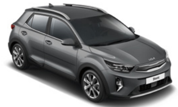
Astrograu Met. (M7G)