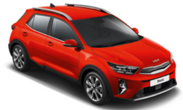
Signalrot Met. (BEG)